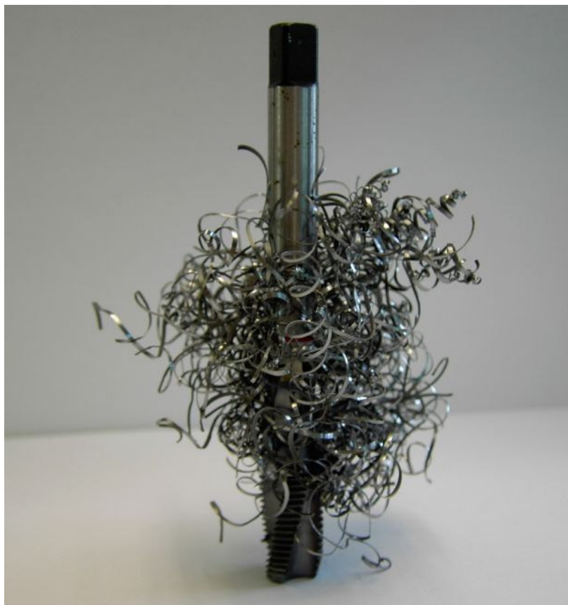
Fig. N°1- Esempio di formazione di truciolo lungo attorcigliato attorno al maschio, fonte di inconvenienti